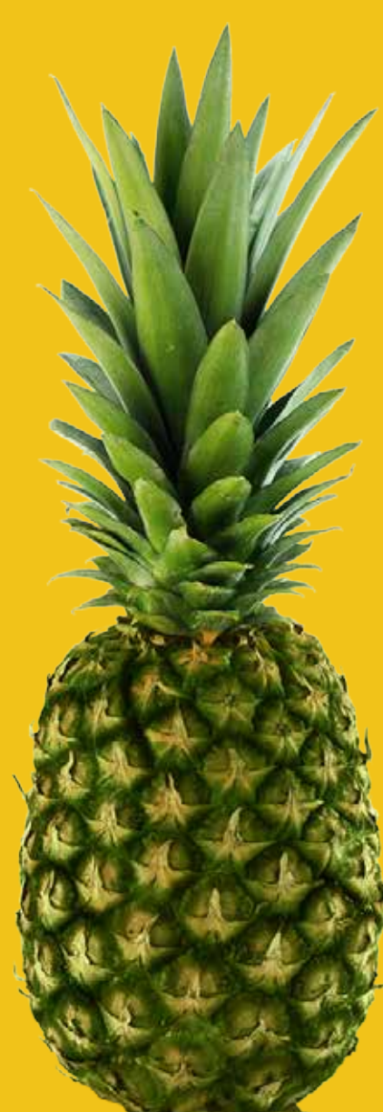
Verde o sazona